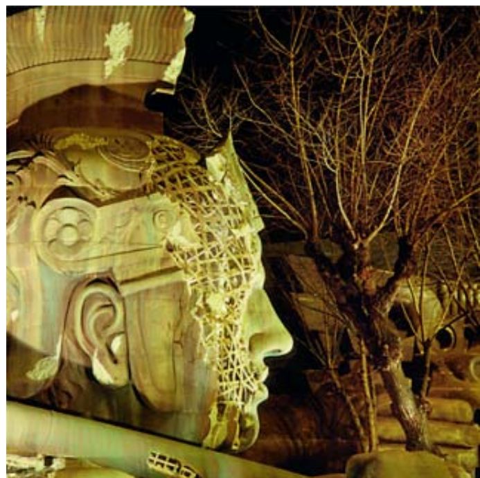
△Pio Tarantini, Cinecittà, Roma, 1995.